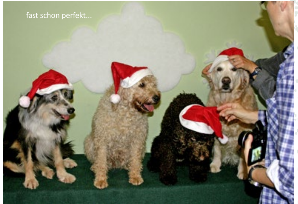
fast schon perfekt...