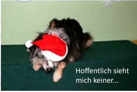
Hoffentlich sieht mich keiner...