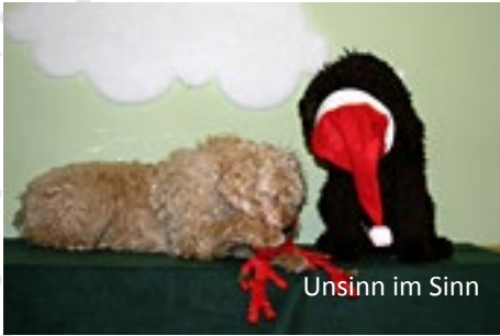
Unsinn im Sinn